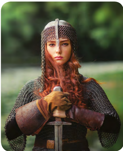
Dillad wedi eu gwneud o faelwisg

Edrychwch ar y lluniau a thrafodwch manteision ac anfanteision pob un gyda'ch partner.