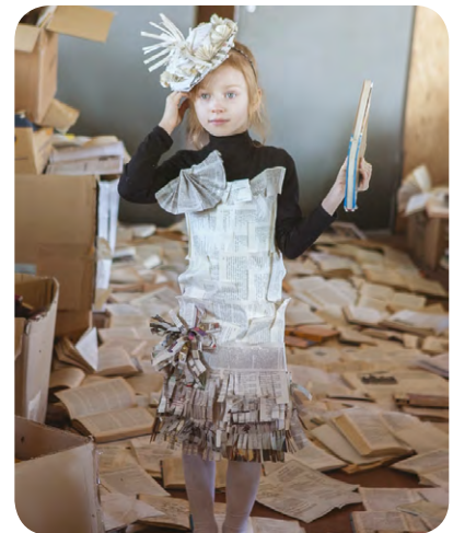
Dillad wedi eu gwneud o bapur newydd