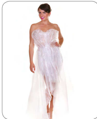
Dillad wedi eu gwneud o blastig swigod